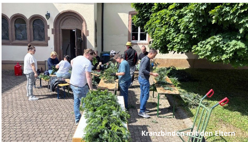
Kranzbinden mit den Eltern