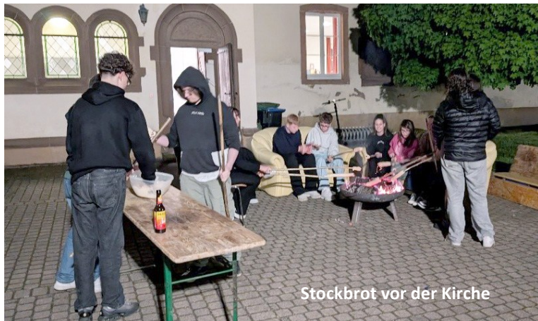
Stockbrot vor der Kirche

Bei Fragen zum Konfirmandenunterricht melden Sie sich bitte beim Pfarramt.