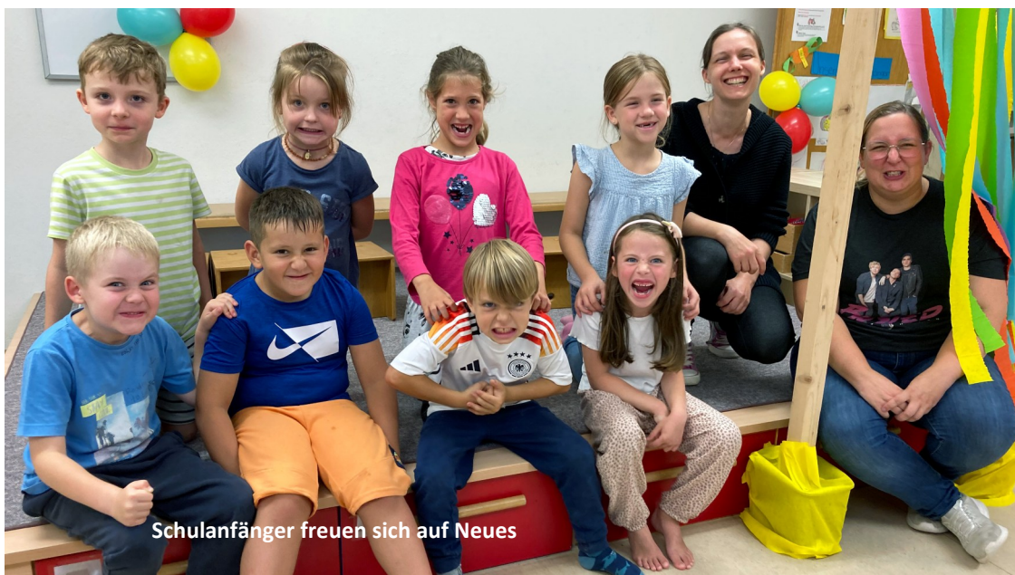
Schulanfänger freuen sich auf Neues

Den Ev. Kindergarten in der Sonnhalde besuchen mehr als 100 Kinder in sechs Gruppen. Die sechste Gruppe zählt der Kindergarten seit 2019 übergangsweise, bis die erste kommunale Kindertagesstätte in Heiligenzell eingerichtet wird.